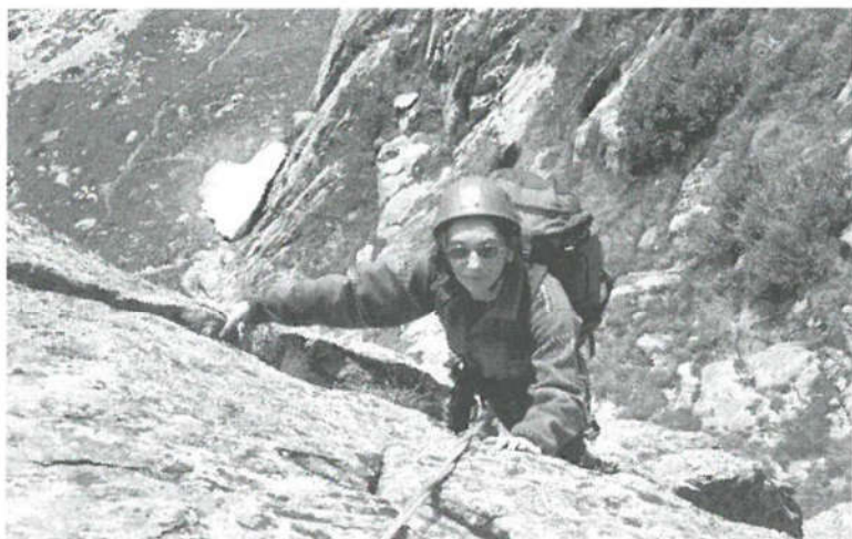
Na płn.-wsch. grani Spazzacaldeira, Bergell, 5 VIII 2001 r.

Z wykształcenia geolog. Całe swoje życie zawodowe związała z Muzeum Ziemi PAN. Pracowała w nim od 1974r, przechodząc kolejne stopnie awansu – od stażysty do kustosa muzealnego, a w 1990r została kierownikiem Działu Popularyzacji. Niewątpliwy talent do przekazywania wiedzy wykorzystywała pracując dodatkowo jako nauczycielka geografii.