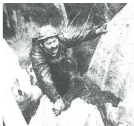
Wyjście z Jaskini Garma Ciega, Hiszpania, sierpień 1975 r.